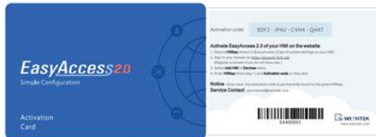
EasyAccess 2.0 开通卡

若您有开通卡，可以使用上面的开通码在 Domain 管理系统中完成人机开通进程。